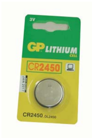
PILHA DE LITIO 3V CR2450