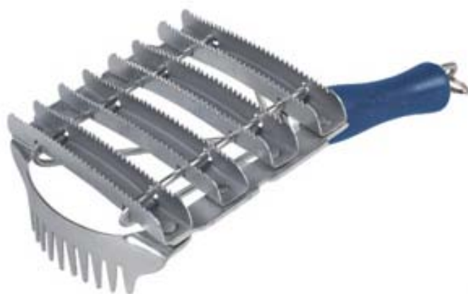
ALMOFAÇA DE AÇO CIRCULAR REVERSÍVEL COM PEGA