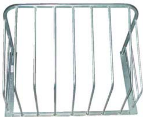
SUPORE PARA PALHA GALVANISADO GRANDE - 70x51x45