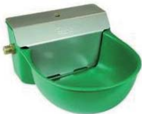
BEBEDOURO SUEVIA MODELO 340

Bebedouro em plástico com válvula flutuadora. Cobertura em aço inoxidável. Ajustamento simples do nível da água.