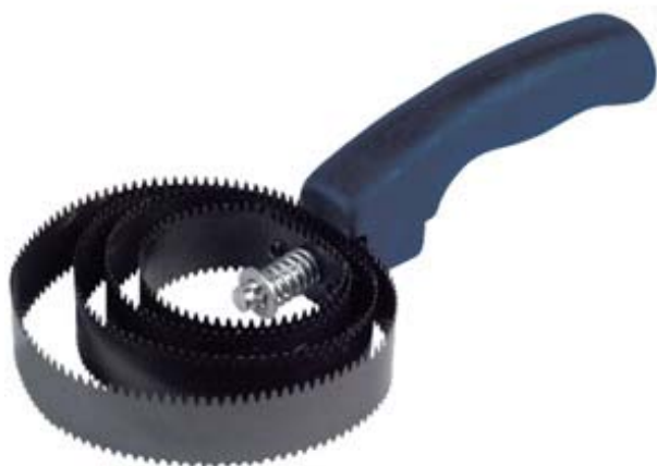
ALMOFAÇA DE AÇO OVAL

Modelo americano com lâminas reversíveis. Os diferentes comprimentos dos dentes podem ser adaptados à sensibilidade do cavalo. Ideal para a fase de muda do pêlo.