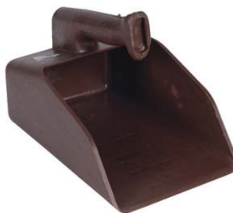
BEBEDOURO SUEVIA MODELO 130P

Polipropileno de alta qualidade, resistente aos raios UV. Manejável e não tóxico.