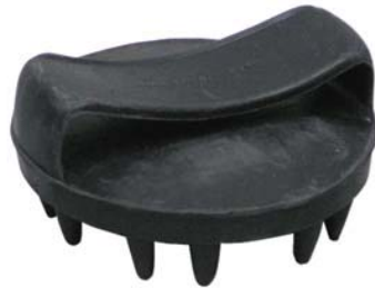
ALMOFAÇA DE BORRACHA COM BICOS