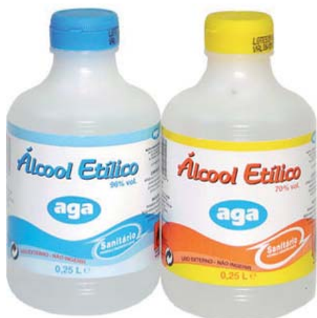
ALCOOL ETILICO SANITARIO 250 ML