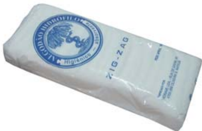
ALGODAO HIDROFILO ZIG-ZAG 100 G - CARDINAL